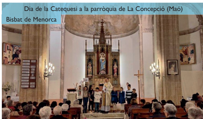
Dia de la Catequesi a la parròquia de La Concepció (Maó) Bisbat de Menorca

Aquesta actitud individualista també es trasllada a l'àmbit de la fe. No podem dir que no hi hagi fe avui en dia, però la dimensió comunitària de la fe sí que està en crisi. Només fa falta veure el número de persones que participen en les celebracions de l'Eucaristia i en els grups parroquials. Volem viure una fe individual, sense pertinença a cap