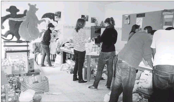
Voluntarios en una sala de preparación de lotes de alimentación, una imagen que se repite desde hace una década.

Durante las últimas reuniones mantenidas con los concejales responsables del área se ha comentado esa situación. «No queremos listas de espera en un asunto tan sensible», añade. Por ese motivo, si este año se han repartido 250.000 euros en la colaboración municipal, en 2021 será el doble, 500.000, para dotar mejor esa colaboración.