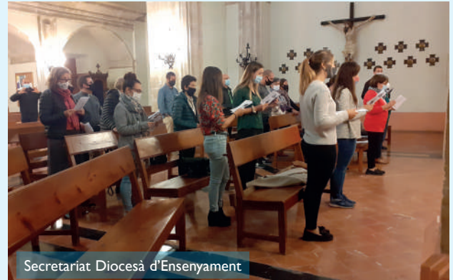
Secretariat Diocesà d'Ensenyament

Aquest any el lema escollit per treballar és " La caritat és amor rebut i ofert ". L'objectiu que ens proposem aquest curs és ser una Església samaritana, fomentant l'actitud d'escolta, de diàleg, d'ajuda i d'acompanyament, sobretot amb les persones, fillats i joves més vulnerables i les que sofreixen perquè trobin amb nosaltres la misericòrdia, el consol i l'esperança. L'acte es va dividir en dues parts. En la primera el Sr Bisbe va presidir la celebració de la