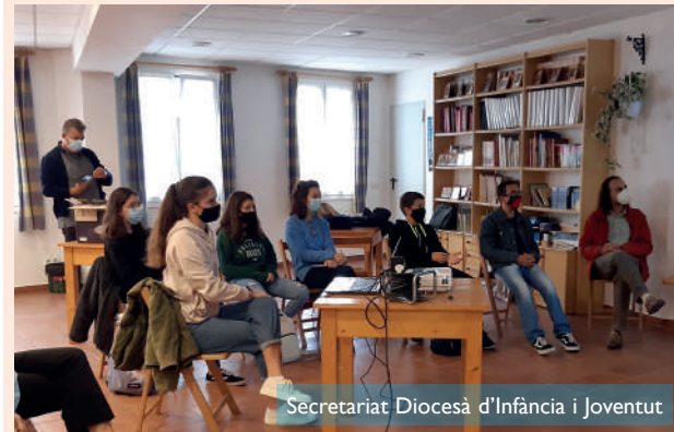
Secretariat Diocesà d'Infància i Joventut

E l passat, 17 d'octubre, es van trobar a la Parròquia de la Concepció de Maó, un grup de joves de diferents comunitats parroquials per conèixer junts. El lema de la trobada va ser " Mou-