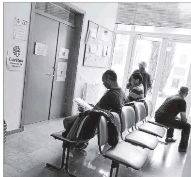
La sede de Caritas Diocesana en el Edificio Calabria de Maó.