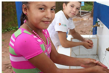
La "innovación" que mejoraría la vida de 4.500 millones de... Patrocinado por Revista Triodos