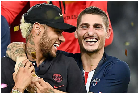
Verratti confirma los contactos con el Barça en 2016