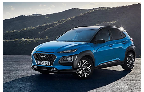
Descubre el nuevo Hyundai KONA Híbrido eléctrico Patrocinado por Hyundai