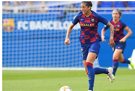
Amenaza de huelga en el fútbol femenino