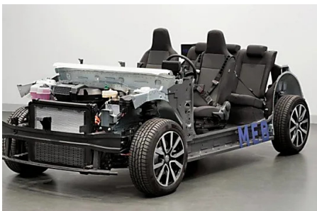
Estas son las claves de MEB, la plataforma sobre la que se... Patrocinado por Motor.es