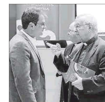
Flores con el obispo Taltavull.