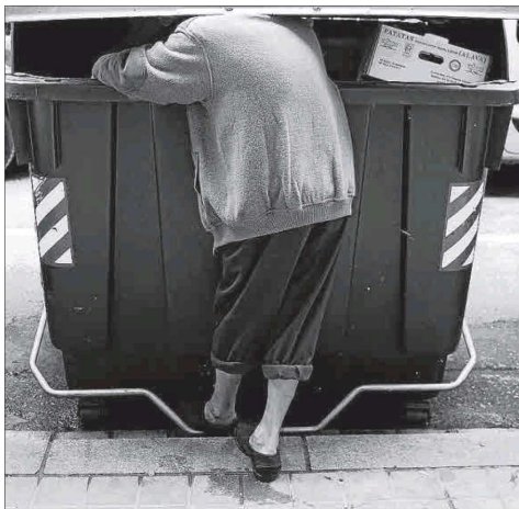
243.000 personas de Balears viven en una situación de exclusión social.

Inquieta la irresponsabilidad con la que se actúa desde determinados foros políticos, contaminados por el electoralismo imperante, cuando los expertos llevan ya meses anunciando que se está preparando una DANA económica de mil pares de narices. Los ocho años de la última recesión deberían haber marcado a fuego el evitar los mismos errores de entonces, las consecuencias ya las conocemos. Por desgracia.