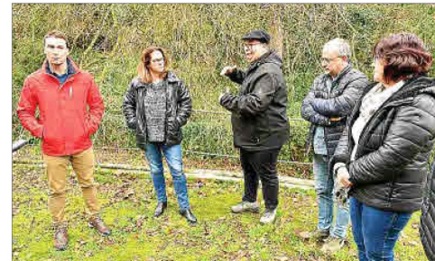
Mantenimiento. La finca gestionada por Caritas cuenta actualmente con el apoyo de dos trabajadores dentro del proyecto de inserción laboral para personas en riesgo de exclusión, que se encargan del cuidado del espacio natural así como de la recuperación de los bienes etnológicos.