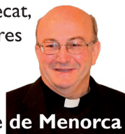
† Francesc, Bisbe de Menorca

No tinguem por d'apropar-nos a ell i contemplar la creu en totes les seves dimensions. Durant aquesta Setmana Santa que començam, alcem els nostres ulls per mirar la creu i omplir-nos de vida. Com els jueus al desert miraven l'estendard amb la serp que Moisès havia aixecat, nosaltres elevem els nostres ulls per omplir-nos de vida.