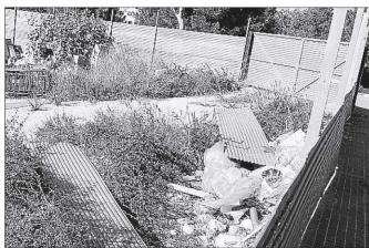
Planchas desprendidas en la calle Sa Coma.

También en Ciutadella los bomberos tuvieron que intervenir para arrancar algunas chapas que se habían desprendido en un solar vallado de la calle Sa Coma y apuntalar otras que podían desprenderse.