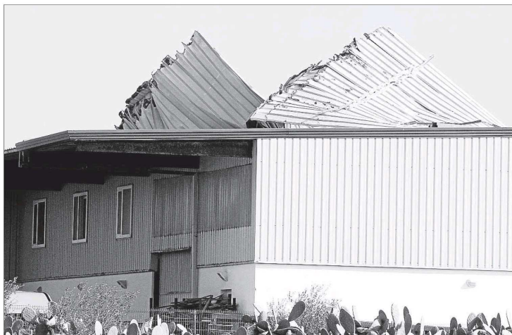
Las planchas se levantaron por la fuerza del viento en toda su zona norte.