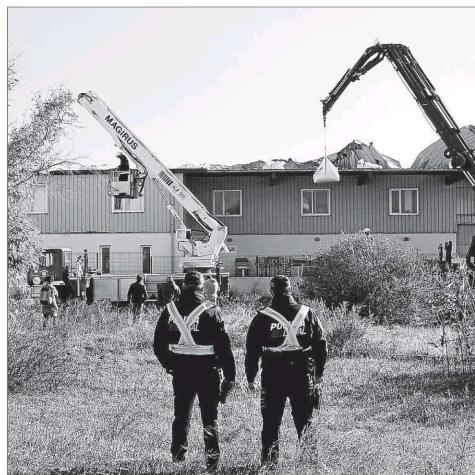
Los bomberos colocan sacas de gravilla en la cubierta de Mestral.