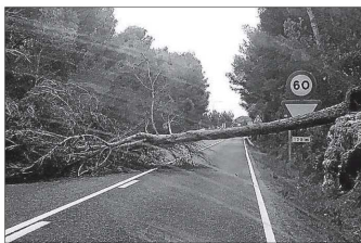
La carretera de Addaia, cortada.

► Fue necesaria la evacuación del personal y la Policía Local cerró la calle ante el peligro de desprendimiento ► Los bomberos la aseguraron con 13 sacas que portaban 3.000 kilos de gravilla