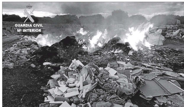
La hoguera con los restos de obra, junto al núcleo urbano de Ciutadella.

El Ayuntamiento de Maó parece tener clara su postura. No ocurre lo mismo con el Consell. Javier Ares, conseller insular de Medio Ambiente, explicó ayer que sus intenciones se centran en ir «paso a paso» y estudiar todas las opciones posibles. Por ello, participará en una reunión con Caritas que tendrá lugar el próximo lunes. Sin embargo, apunta a la próxima junta del Consorcio de Residuos como el encuentro en el que se deben tomar las primeras decisiones. Declinó opinar sobre la idoneidad de construir una nueva planta.