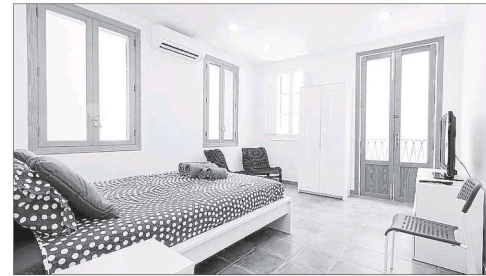
Vivienda para alquiler vacacional publicitada en internet.

► Urge devolver la normalidad a la principal vía de comunicación de Menorca, la Me-1, y finalizar el proyecto de ampliación y mejora. Ambas patronales, PIME y Caeb, llevan este punto en su listado de prioridades y lamentan que las obras no avancen al ritmo adecuado. Consideran que la carretera general ya lleva demasiado tiempo en estado provisional, especialmente el tramo de Maó a Alaior.