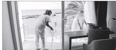
Camareras de piso limpian una habitación de hotel.

► Menorca ha cuidado su paisaje pero para el GOB queda mucho que hacer en la lucha contra el cambio climático, la producción de renovables y en preservar un recurso vital: el agua.