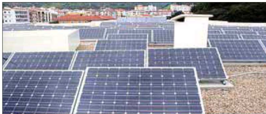
Placas solares en la cubierta de un edificio.

► Caeb pide coherencia entre ayuntamientos a la hora de zonificar el alquiler turístico, PIME quiere que la administración ofrezca ya una solución definitiva al problema y UGT reclama que se regule y limite esta actividad económica para evitar «bolsas de fraude».