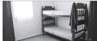
El piso de acogida del edificio Calabria.

► UGT y CCOO reclaman más medios para la Inspección de Trabajo. Estiman prioritario el reparto más equitativo de la riqueza que se genera en la Isla a través de mejoras salariales.