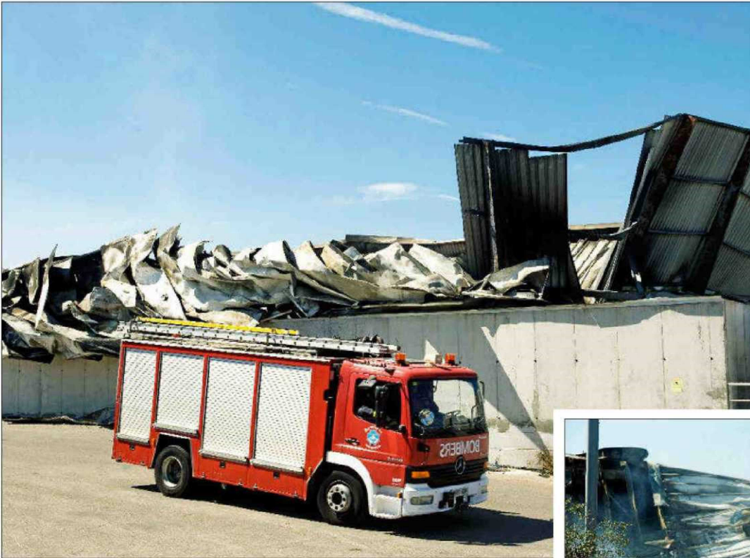
Estado en el que ha quedado la planta de residuos tras el incendio.