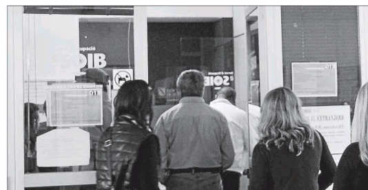
Imagen de archivo de varias personas haciendo cola en una oficina del SOIB.

► La estacionalidad se evidencia en los trabajadores que tienen un contrato indefinido fijo-discontinuo. Mientras que en invierno la cifra de menorquines con este tipo de contrato se sitúa en los dos mil trabajadores (a finales del año pasado eran 2.104), en verano se dispara superando los 6.000 contratos.